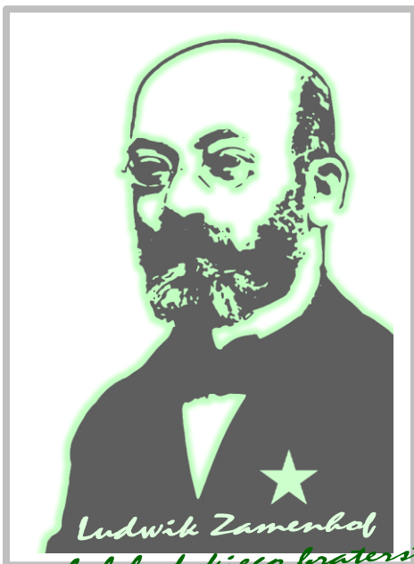
Ludwik Zamenhof symbol ludzkiego braterstwa Ludovico Zamenhof simbolo de interhoma frateco

20 listopada 2014 roku Minister Kultury i Dziedzictwa Narodowego wydał zgodę na wpisanie Esperanta na Listę Niematerialnego Dziedzictwa Kulturowego NID.